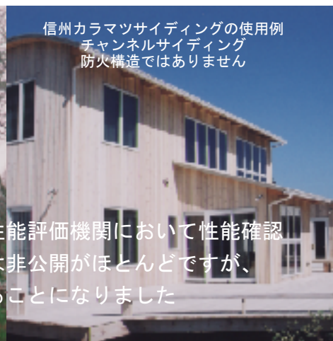
信州カラマツサイディングの使用例 チャンネルサイディング 防火構造ではありません

建築基準法に規定されている防火構造・準防火構造は国土交通省の指定した性能評価機関において性能確認試験を行い、国土交通大臣の認定を受けなければいけません。性能確認試験は非公開がほとんどですが、信州カラマツの特性を知っていただくため関係機関の協力を得て、公開することになりました